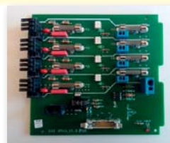
Scheda potenza Moduli 4 (15A)